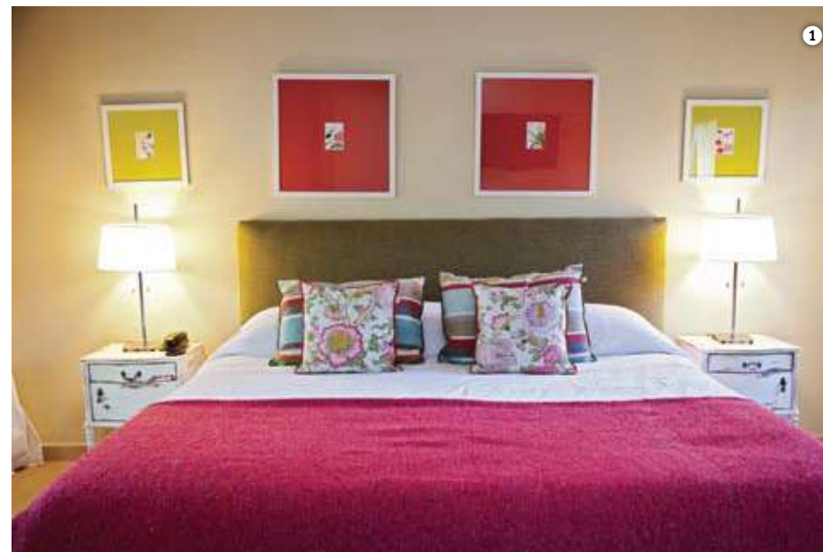
1 Habitación en posada Los Eucaliptos . 2 El parque de esa posada. 3 Parte de la fachada de la iglesia parroquial. 4 El palomar de la posada del mismo nombre.