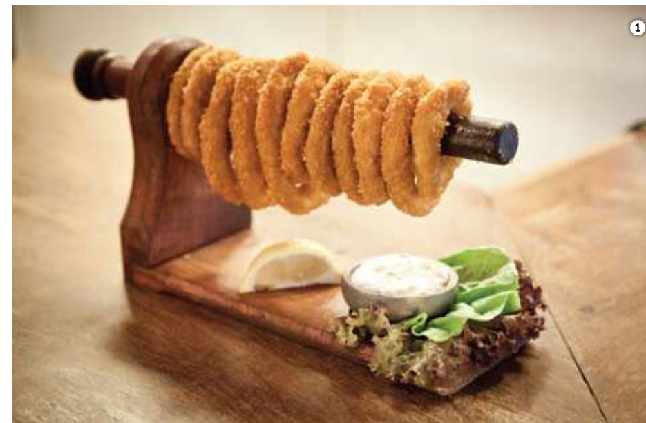
1 Peculiar manera de presentar las rabas en la mesa de Trevi. 2 Museo del Periodismo Bonaerense. 3 Estanque con nenúfares en Itaca. En la apertura, cardos en esa finca.